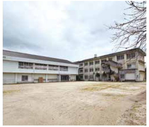
令和8年度末をもって閉校となる新野東小学校