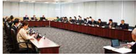
決算審査特別委員会の様子

12月定例会において継続審査としていた、令和6年度一般会計及び16事業の特別会計を合わせた計17件の決算認定議案について、令和8年1月29日に決算審査特別委員会を開催し、議案の審査を行いました。