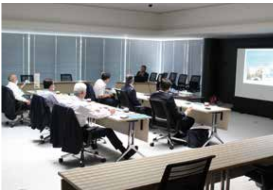
5 月 15 日 岡山県備前市議会議員 6 人