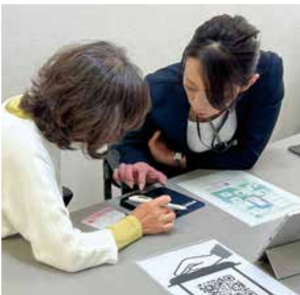
デジタルなんでも相談室のようす

さらに、令和6年度からは、デジタル機器に関する悩み事の相談に職員が対応するデジタルなんでも相談室を各公民館等で実施しており、令和6年度は76人、今年度は73人が参加した。また、今年度