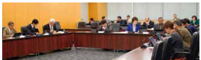
総務委員会のようす

さらに委員から、県の補助金が原資であるが、今後、何年分どの程度基金を積み立てる計画であるのかとの質疑があり、県補助金を活用するため本基金を設置するものであり、県補助金が次年度以降も継続された場合、県補助金に相当する額を基金に積み立てることとしているため、規模としては県の補助金額と同等額になるとの説明があった。