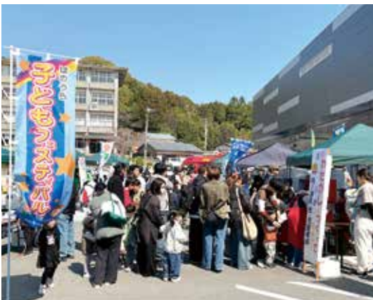
復活したはのうら子どもフェスティバル

また、意見を聞いて終わりではなく、どのような意見をいただき、施策にどう反映していくのかをこどもたちに分かりやすく示し、自分たちの意見で、阿南市をより良いまちに変えていけることを実感できるようにすることで、本市の将来を担う若者の市政への関心、参画へとつなげていきたいと考えている。