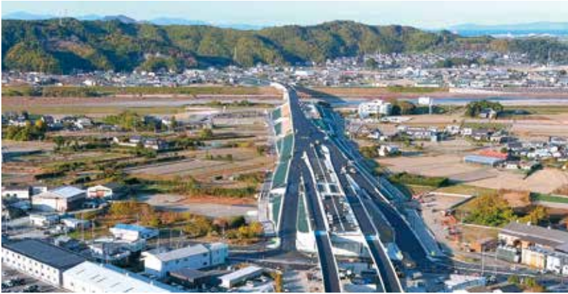
阿南インターチェンジ周辺

土地利用について、プロジェクトチームでの議論に専門的な知見を加えて、まちづくりや土地利用の規制・誘導に係る課題の整理を行い、エリアのゾーニングや土地利用の評価を実施している。