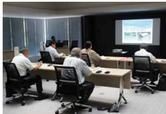
7 月 31 日 三重県名張市議会議員 5 人