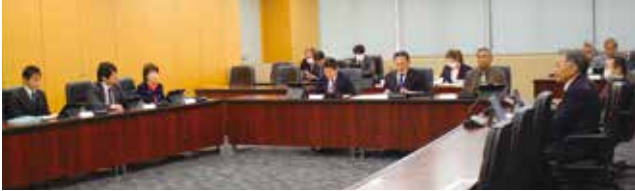
文教厚生委員会のようす

タイミングで増税することを選択したのかとの質疑があり、近年、医療の高度化や前期高齢者の占める割合の増加に伴い、1人当たりの医療費が増加していることから、税率の引き上げが必要な状況と