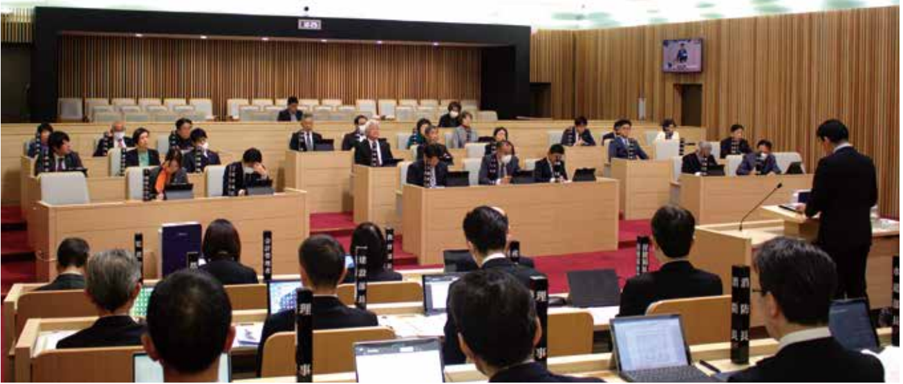
3月定例会のようす