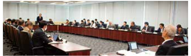
予算審査特別委員会の様子

地の魅力とにぎわい創出、活性化につなげるため、中心市街地空き店舗を利用して新たに事業を行う方を対象に、店舗の改修や施設の借り上げ等に要する費用の一部を補助する事業であり、1件当たり100万円程度を限度とし、交付するものであるとの説明があった。