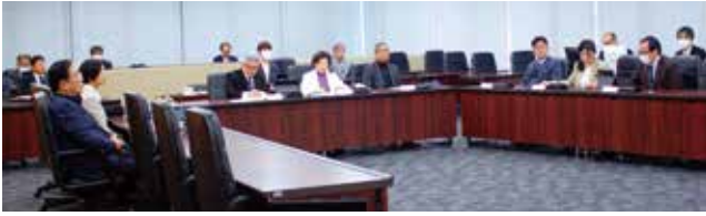
産業建設委員会のようす

を行い、残ったスペースについては、市が芝生広場として整備し、活用するとの説明があった。