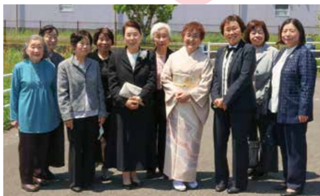
赤飯調理・配食ボランティアグループ

平成2年1月の設立から34年の長きにわたり、安否確認と見守りを目的として、那賀川地区の1人暮らしの高齢者宅を対象に毎月1回赤飯を調理し、友愛訪問員と共に配食訪問を行っています。高齢者の安心できる地域づくりの推進を目標に損得を考えないボランティア活動で高齢者をサポートし、地域福祉に大いに貢献されました。