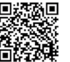
阿南高専公開講座 ホームページ

※各講座のチラシを阿南高専公開講座ホームページに掲載しています。受講料などの詳細は、こちらの2次元コードから各チラシをご確認ください。 場所 阿南高専