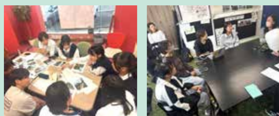
学生実行委員会(高校生の部) 学生実行委員会(大学生の部)