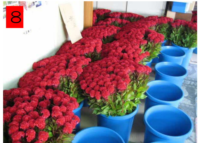
バケツに入れて水につけておく。