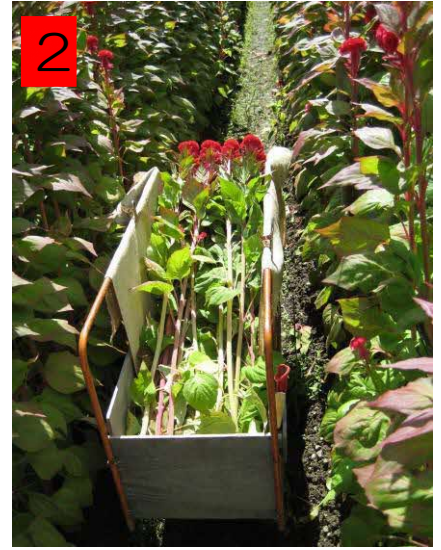
2 台車に丁寧に乗せていく。