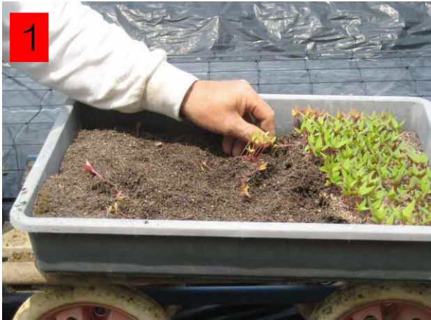
1 細根を切らないように1つ1つ丁寧に苗をとる。