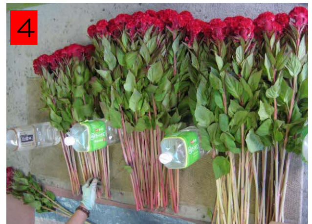
出荷規格に合わない不必要な葉を除去する。