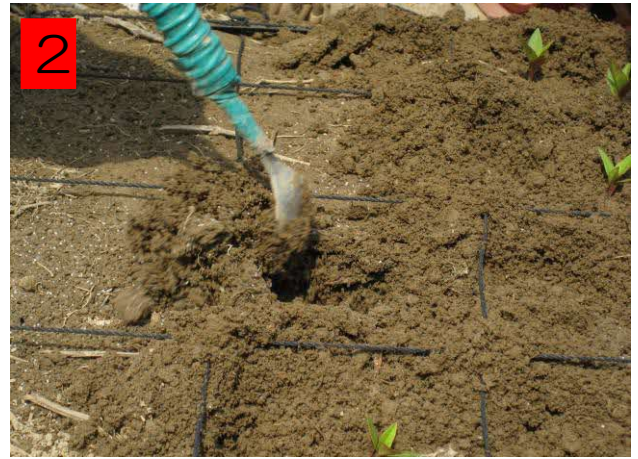
2 小さいスコップを使い、植え穴を掘る。