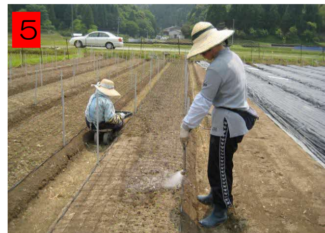
6 定植後はかん水する。