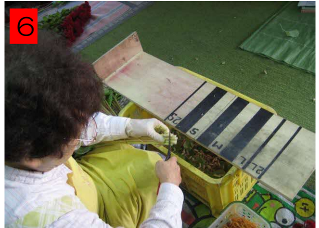
不揃いになった軸を切って揃える。