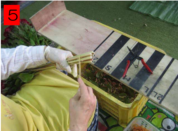
10本ずつゴムバンドで結束する。