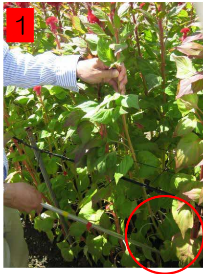
1 花頭の下の軸を持ち、 地際部の軸を切る。