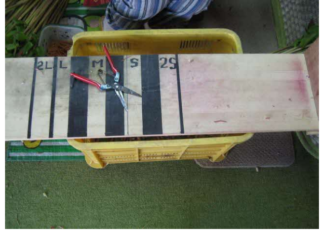
選別作業に使うハサミと長さを測る板（自作）