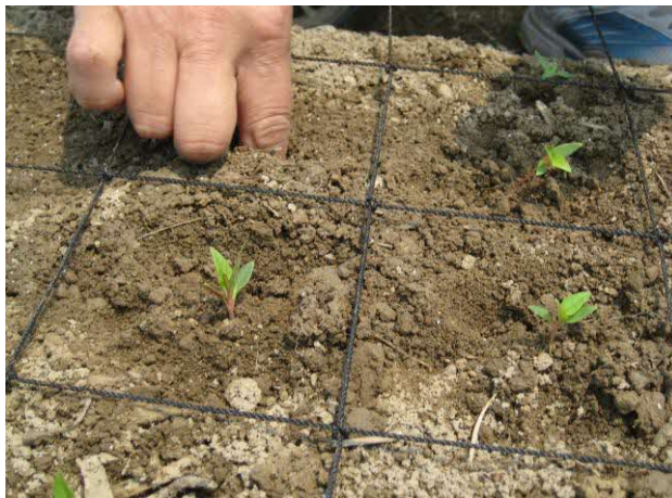
3 指で植え穴を掘る方法もある。