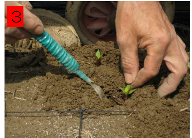
4 1つ1つ丁寧に苗を植える。