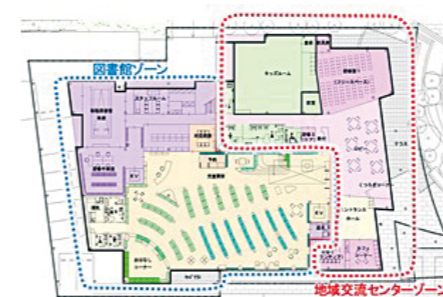
1階 地域交流センター・図書館児童開架室