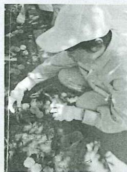
地域の企業への植栽活動

阿南支援学校では、開校当初から地域との連携や協働をもとにした特色ある取組を行っています。これまで、阿南市における放置竹林対策としての竹炭作りや、竹の繊維を紙の材料にした竹紙作りなどに取り組んできました。また、地域の小・中学校や高校との交流及び共同学習、地域の行事に参加しています。さらには、地域の企業や公共施設への地域貢献活動のほか、地域の企業団体等とのコラボレーションによる社会貢献活動、キャリア教育の推進等にも取り組んでいます。このような取組を通して、児童生徒が社会の一員として、貢献したり、助けられたりするよう、社会とのつながりを大切にすることができています。