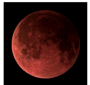
昨年の皆既月食の様子 （令和7年9月8日3:00頃）

事前・当日の取材・出演・解説などの依頼、大歓迎！ 資料・画像・映像の提供も可能です。