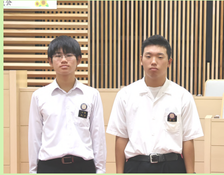
2班 阿南第一中学校