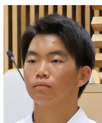
遠藤 優斗 議員

ご答弁ありがとうございました。スポーツで阿南市を盛り上げるためにスポーツを全力で楽しむこと、スポーツの魅力を教えることなど、自分たちにできることを積極的に行動していき、阿南市とともに盛り上げていきたいと思えます。