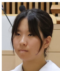
吉岡 陽菜乃 議員

ご答弁ありがとうございました。私たちの身近にある公園が、様々な方のご協力の中、整備されていることをあらためて知りました。公園は、幅広い世代が利用する場なので、大切にしていきたいです。ありがとうございました。