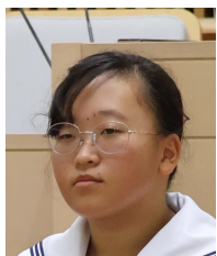
二階 優花 議員

ご答弁ありがとうございました。阿南市の魅力をもっと知っていただくために、いろいろな取組をしていることが分かりました。ですが、それに加えて、阿南市の商店街をもっと盛り上げてほしいです。