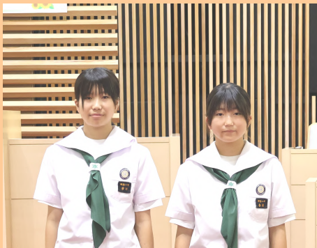
4班 阿南第二中学校