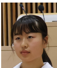
澤田 彩音 議員

ご答弁ありがとうございました。ラーケーションが導入された際には、ぜひ家族と一緒に過ごす時間をつくりたいと思います。