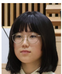
西谷 咲良 議員

ご答弁ありがとうございました。街灯のほとんどにLEDが使われているということをお知らせして知り、周りの人たちにもそれを伝えたいと思いました。また、街灯設置の提案をする場に参加し、それについても一緒に考えたいと思いました。