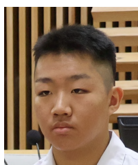
野村 旺志郎 議員

ご答弁ありがとうございました。スポーツで阿南市を盛り上げるためにスポーツを全力で楽しむこと、スポーツの魅力を教えることなど、自分たちにできることを積極的に行動していき、阿南市とともに盛り上げていきたいと思えます。