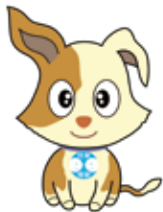
行政相談マスコット「キクーン」