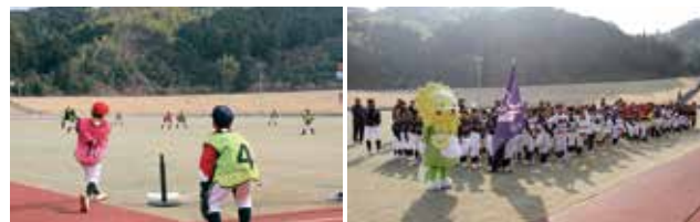
(ティーボール大会の様子)

【新規】AIカメラ導入経費 500万円 アグリあなんスタジアムにAIカメラを設置し、試合映像のウェブ配信やDVD販売を行います。