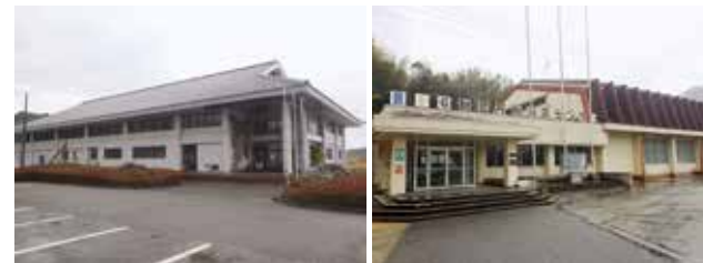
(武道館) (B&G海洋センター体育館)

【新規】体育施設トイレ洋式化事業 320万円 武道館、B & G海洋センター体育館、春日野体育館の男女トイレを2カ所ずつ洋式化し、利用者の利便性向上を図ります。