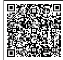
↑ 高齢者バス乗車券