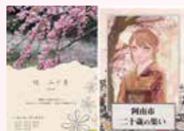
二十歳の集い実行委員会が作成したプログラム