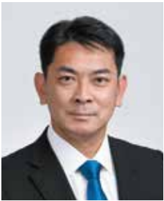
阿南市長 岩佐 義弘

阿南市では、株式会社サイネックス様と協働で「阿南市暮らしのガイドブック（2024年版）」を作成し、市内の各世帯及び転入世帯に配布しようと考えております。