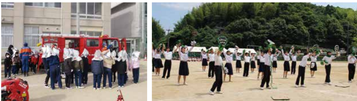
写真と本文は直接関係ありません。