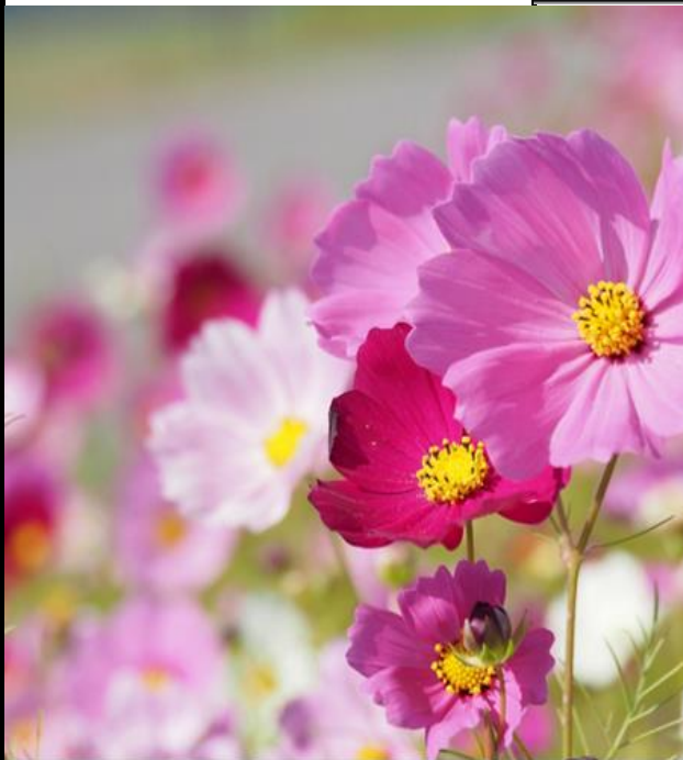
那賀川町のコスモス：撮影 令和3年

あんぜんかくにんをするときは、 車・バイク・直でん車 が走っていないか、 曲がってくる車 が走っていないか、 まわりをよく見てから 道をわたろう!