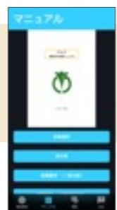
職員防災初動アプリ

LINE株式会社への研修派遣を修了した職員は、阿南市役所への帰任後、災害発生時における「職員防災初動アプリ」の開発や阿南市公式LINEを活用した電子申請サービスの構築等の業務に従事しています。