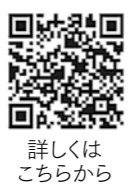
詳しくは こちらから