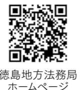
徳島地方 法務局 ホームページ

遺言書保管申請の方法については、徳島地方 法務局ホームページをご 確認いただくか、徳島地 方法務局阿南支局まで お問い合わせください。