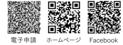
電子申請 ホームページ Facebook

相談料 無料(労働者、経営者いずれの方も利用できます。) ※徳島県労働委員会では、労使間トラブルの解決のお手伝いをするため、相談やあっせん申請を随時受け付けています。 徳島県労働委員会事務局 ☎088-621-3234 FAX088-621-2889 e-mail:roudouinkai@pref.tokushima.jp