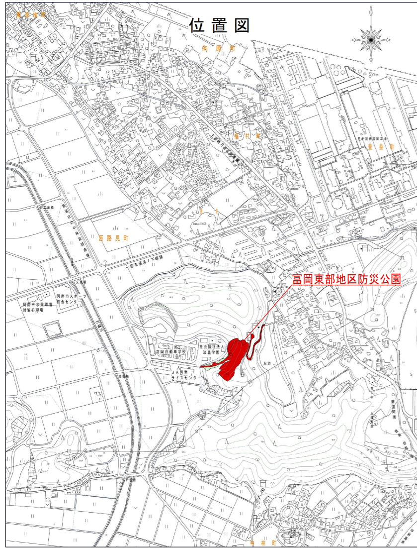
富岡東部地区防災公園 平面図