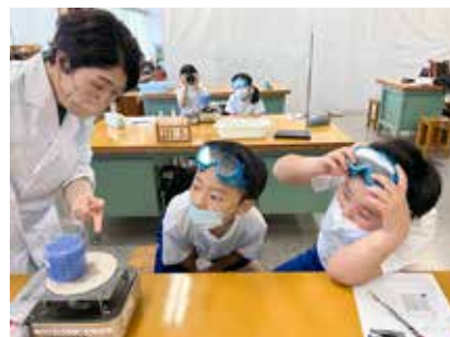
写真と本文は直接関係ありません。