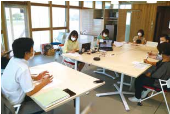
市民と意見交換をする表原市長

皆さまからいただいた貴重なご意見・ご提言は、本市の各種計画等に可能な限り反映させていただきます。