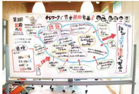
出前市長で用いられるグラフィックレコーディング