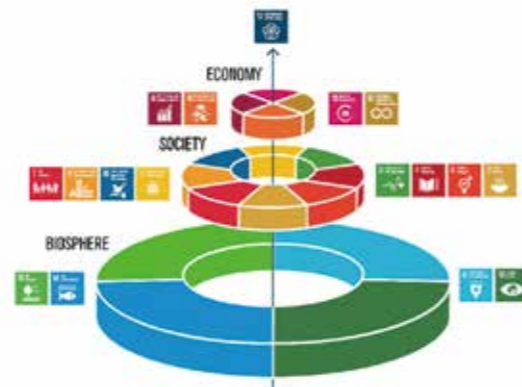
図 SDGsにおける17の目標と生物圏、社会、経済との関係性 (ストックホルム レジリエンス センターより)