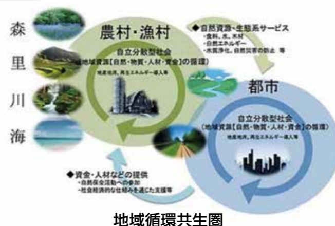
図 地域循環共生圏のイメージ図(環境省)

自立・分散型の社会を形成しつつ、近隣地域等と地域資源を補完し支え合うという考え方(国の第5次環境基本計画抜粋)です。魅力的な地域資源を持続的に活用しながら、本市の経済・社会・環境の統合的な向上をめざします。