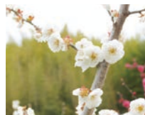
市の木「梅」 (昭和63年6月制定)

三 島影はゆる 橋に 真珠が若き 夢呼べば 船足かるく はつらつと 伸びる港に 明日がくる あゝわれ よくぞ生まれたり 栄えゆく 阿南の郷に