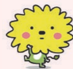
阿南市イメージアップキャラクター 「あなん」

発行日 令和3年3月 発行 阿南市 〒774-8501 徳島県阿南市富岡町トノ町12番地3 ☎0884-22-1111 (代表) FAX 0884-22-6772 URL https://www.city.anan.tokushima.jp 編集 企画部 企画政策課