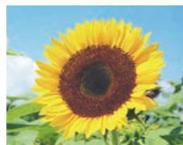
市の花「ひまわり」 (平成3年12月制定)

梅は、バラ科の落葉樹であり、早春に他の花に先駆けて開花し、ふくいくたる香りが高く、優雅なことから制定されました。