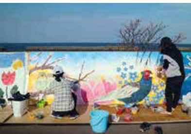
春らしさ満開の一枚絵