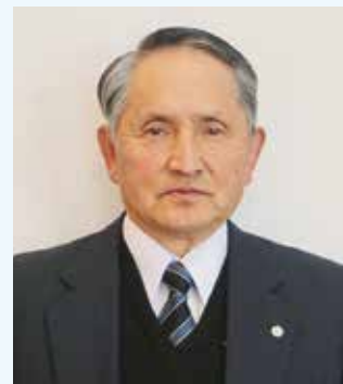
阿南市民生委員・児童委員協議会会長

これらの課題解決に向け、日ごろから地域の繋がりを強め、見守り活動や絆づくりをしていきながら、地域福祉の担い手としての自負と熱意を持って、民生委員・児童委員活動に積極的に取り組んでまいりますので、今後とも皆さまのご協力を、よろしくお願いいたします。