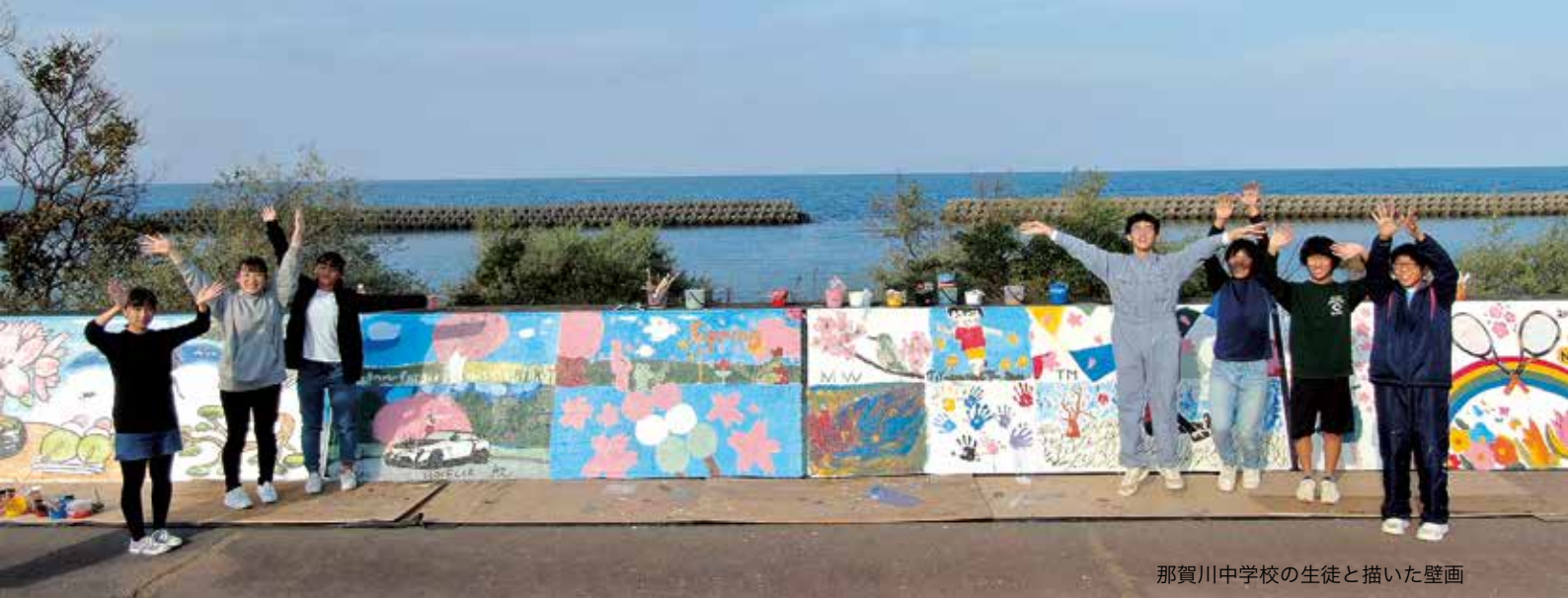
那賀川中学校の生徒と描いた壁画