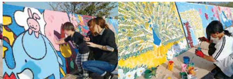
手のひらでサクラの花びらを表現