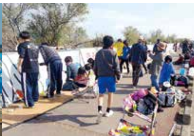
防潮堤に人がいっぱい