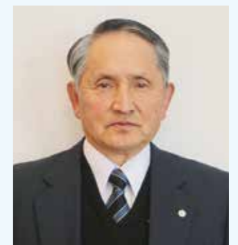
阿南市民生委員・児童委員協議会会長

これらの課題解決に向け、日ごろから地域の繋がりを強め、見守り活動や絆づくりをしていくながら、地域福祉の担い手としての自負と熱意を持って、民生委員・児童委員活動に積極的に取り組んでまいりますので、今後とも皆さまのご協力を、よろしくお願いいたします。