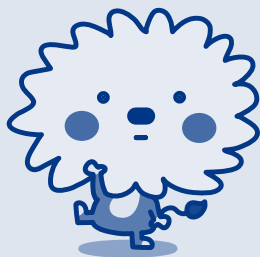
阿南市 イメージアップキャラクター 「あななん」