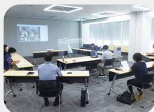
意見交換会・連絡会（訪問介護） 【オンライン会議】 令和2年9月12日