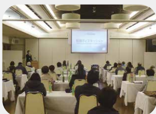
第1回在宅医療・介護連携促進会議 令和2年11月26日