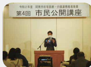
市民公開講座（動画ディスカッション・映画等） 令和3年2月28日