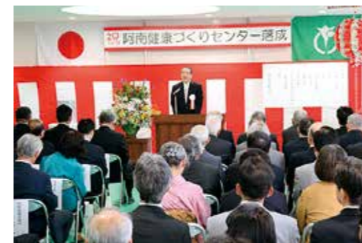
(写真：落成式の様子)

本市が平成29年6月から阿南中央病院正面の市道を挟んで南側、宝田町荒井に建設を進めてまいりました「阿南健康づくりセンター」が完成し、5月20日、関係者約90人の参加のもと落成式を執り行いました。 健康づくりセンターは、徳島県厚生農業協同組合連合会（JA徳島厚生連）が運営する「阿南医療センター」の整備に伴い建設したもので、地域住民一人ひとりの健康づくりを総合的に推進するための施設です。 7月2日には、保健センターの業務を移転開始し、一次救急（初期救急）を担う夜間休日診療所は、9月2日に開院の予定で進めています。 今後、健康づくりセンターが保健・医療行政の拠点施設となるよう努めてまいります。