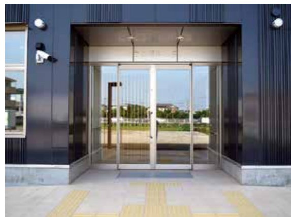
夜間休日診療所入口