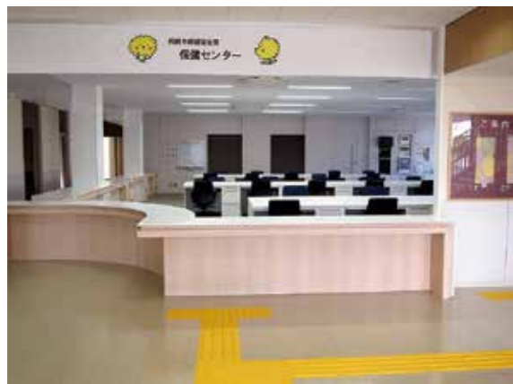
1階 保健センター事務室

健康づくりセンターは、1階に保健センターや一次救急（初期救急）医療を担う夜間休日診療所など、2階には赤ちゃんから成人の方までの健診や相談ができるスペースを配置した複合施設です。また、災害時には阿南市医師会会員の活動拠点になるとともに、来春に開院をめざしています二次救急医療を担う阿南医療センターの医師等の負担軽減を図るために建設したものです。