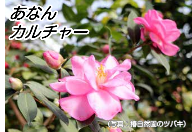
あなんカルチャー

第57回阿南市春季美術展の出品作品を募集します。 開催日 5月3日(祝)~5日(祝) 場所 文化会館 視聴覚室および研修室 出品資格 阿南市に在住または出身者および本市と関係の深い方で阿南市美術協会の会員 (初めて出品される方は、阿南市美術協会に入会していただきます) ※小・中学生は出品の受付ができません。 作品規格 日本画 6号~50号 (額装または表装) 洋画 6号~50号 (額装) 50号は縦額のみ 書道 縦横自由 写真 単写真、組写真とも半切及びA3~全倍サイズ 画面の長辺は40cm以上90cm以内 スクエアサイズ (正方形) は一辺が30cm以上50cm以内 組写真は1パネル (90cm×180cm以内) に全作品を縦に固定 彫塑・工芸・デザイン 横1.5m×縦1.5mまでで、展示にふさわしいように仕立てること。 ※規格以外の作品は受付・展示しません。 ※額装にはガラスを用いないこと。(工芸の押し花作品のみガラス可) ※アクリル板の使用は可 (日本画はアクリル板も不可) 出品点数 1人につき1部門あたり2点まで 会費・出品料 出品料は1点につき500円 美術協会年会費1,500円 (初めて出品される方および3年以上出品されていない方は、入会金1,000円が必要) 作品の受付・搬入 4月30日 (振休) 9:30~12:00 文化会館2階 研修室 ※この日以外は受付できません。 問い合わせ 文化振興課 (☎22-1798) へ