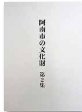
阿南市の文化財第2集 (1冊 1,000円)