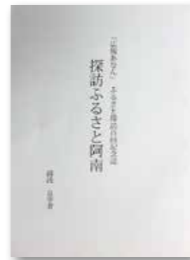
探訪ふるさと阿南 (1冊 500円)