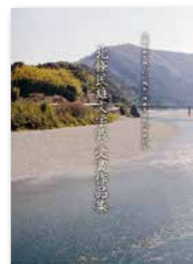
北條民雄文学賞受賞作品集 (1冊 500円)

※阿波公方・民俗資料館では、平島公方に関する書籍を販売しています。 問い合わせは 文化振興課(☎22-1798)へ ※今月のふるさと探訪は都合によりお休みします。