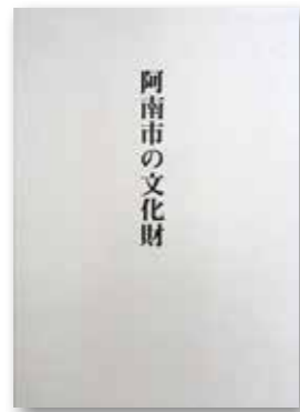
阿南市の文化財 (1冊 2,000円)