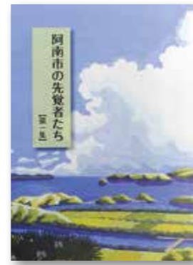
阿南市の先覚者たち第1集 (1冊 300円)