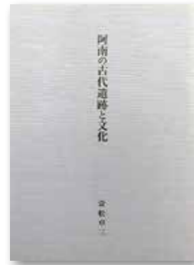
阿南の古代遺跡と文化 (1冊 500円)