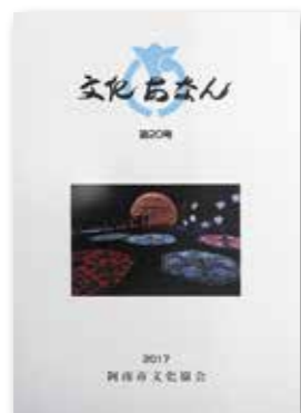
文化あなん第20号 (1冊 1,000円)