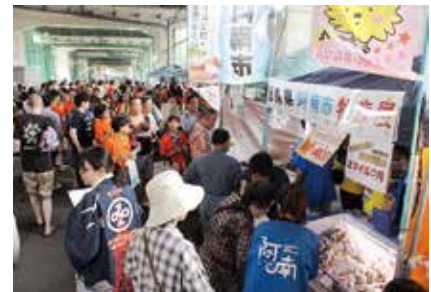
白金阿波踊りのようす

7月16日(日)に「白金阿波踊り」模擬店エリアにて「阿南市ブース」として初出店しました。東京事務所職員と東京・阿南ふるさと会や同会の若手グループ「ちゃらんぽらん会」のメンバーらが、「はもクリームコロッケ」やすだちなど特産品の紹介と販売のほか、観光や移住関連パンフレットを配布しました。