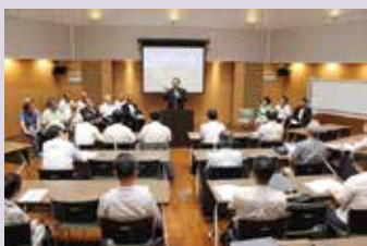
定期総会であいさつする岩浅市長

東京・阿南ふるさと会は、首都圏在住の阿南市出身者、ゆかりがある方、企業などで組織し、首都圏でのさらなる阿南市のPRや相互の情報交換、交流を促進しています。現在では会員は270人を超え、人の輪がさらに広がっています。定期総会を7月25日(火)に開催し、10月3日(火)には東京ドームホテルで“あなん大同窓会”と銘打った「東京・阿南ふるさと光流会」を開催します。