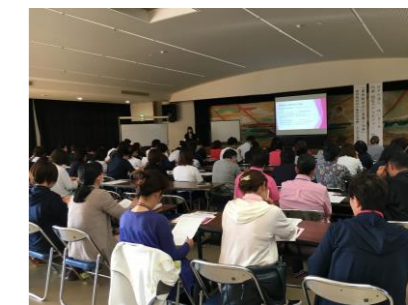
10/24 位頭薫先生 主任ケアマネネットワーク会議② 「事例検討会の意義と効果」