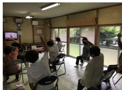
9/14 海老川百歳かい(新野)

いきいき百歳体操・あななんサロンの支援、認知症サポーター養成講座・家族介護者交流会の参加希望も随時受付中です。