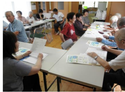
9/15 生谷いきいきサロン・広重ふれあい会(新野)