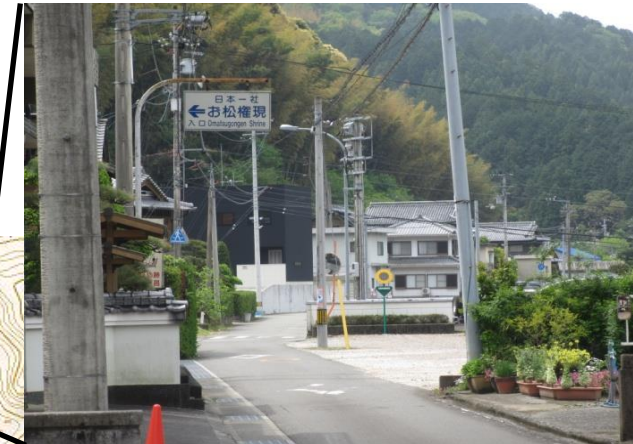
東加茂避難路 加茂谷堤内(TP +26.0m)