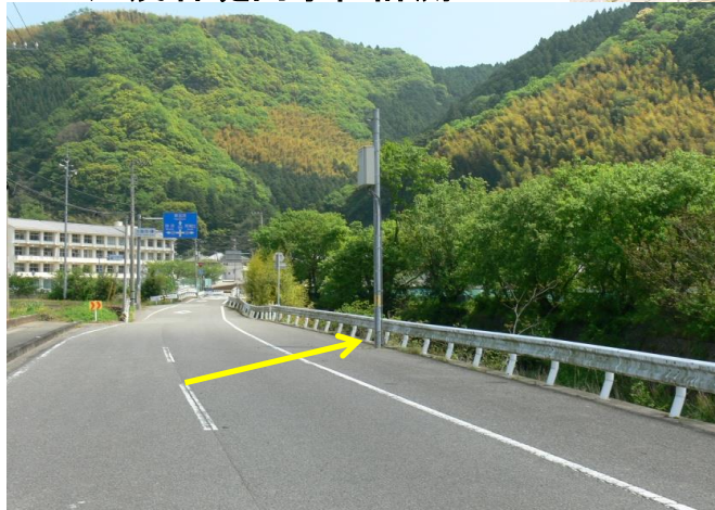
加茂谷堤内水位計測