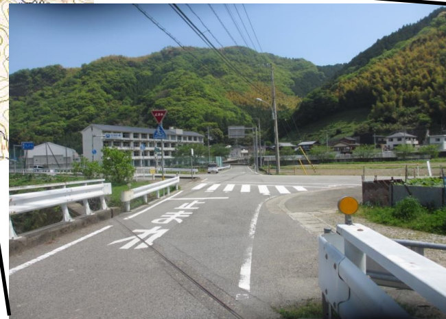
東加茂と西加茂間の県道 加茂谷堤内(TP+24.0m)