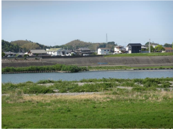
左岸7k4 古庄換算天端高9.8m