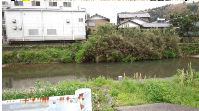
20k4右岸 新野(秋山)換算天端高3.61m (1時間前水位3.1m)