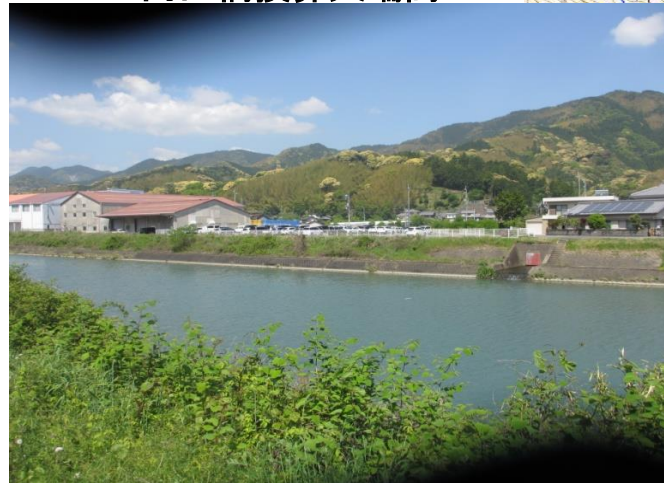
15k6左岸 内田橋換算天端高5.44m