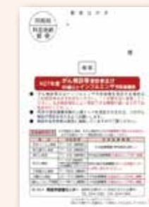
▲がん検診の受診券です