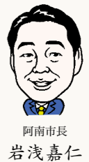
阿南市長 岩浅嘉仁