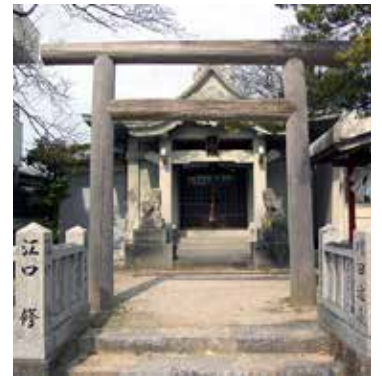
古鳥神社 (宝田町川原)