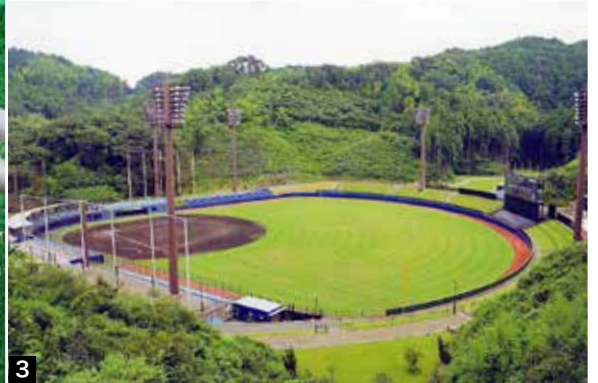
1 選手とコミュニケーションをはかる山田さん 2 山田さんを“阿南の父”と慕う神谷選手 3 緑に囲まれたスタジアムは“森の中の球場”とも呼ばれている