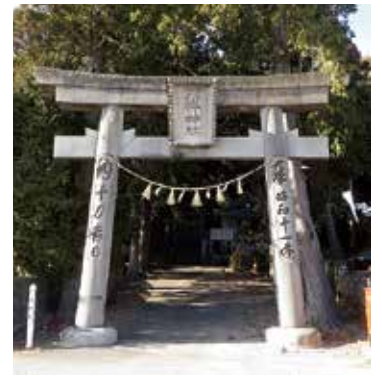
八杵神社 (長生町宮倉)

賀志波比売 (女神賀志波比売命)津乃峰町東分の津峯神社。もと見能林町柏野の賀志波比売神社(異説あり)。