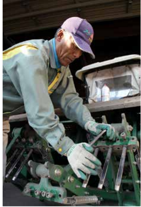
機械のメンテナンスはお手のもの