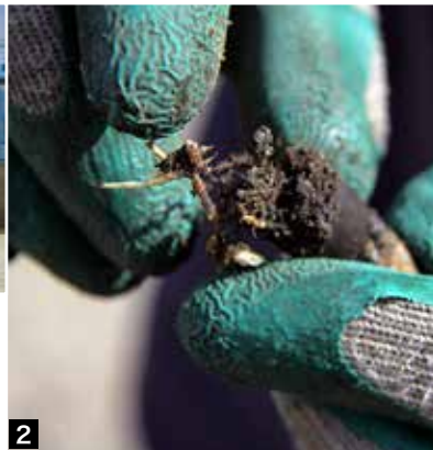
1 徳島市球技場を視察するようす 2 根腐れを起こした芝 3 冬場も熊手を使ってサッチを除去している