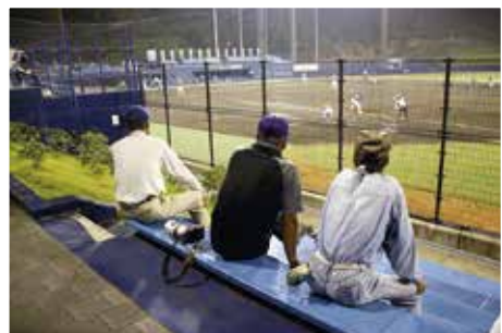
1塁側スタンドから観戦するようす