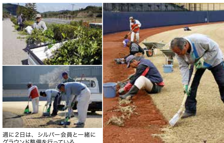
週に2日は、シルバー会員と一緒にグラウンド整備を行っている

グラウンドの管理は、季節によって内容も回数も異なる。芝生が活性する6月以降は、週2、3回の芝刈りや水やりに加え、雑草やサッチ（芝生の成長とともに下部が枯れてできるカス）の除去といった作業も頻繁に行わなければならない。一方、冬場は芝生を養生させるため、砂を入れ替えてじっくりと力を蓄えさせる。内野の土も、黒土と砂の割合を変えている。太陽の照り返しが強い夏場は、黒土を多めに配合