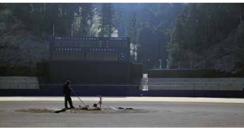
やり残したことはないか。ただ、静かな時間が流れていく。

どれくらい転圧されたのですか？ 「ほうやなあ、20回くらいかな」 そろそろ完成ですか？ 「いや、まだまだ」 漆塗りに似た作業は、月も後半になる頃には表面も鏡のような均一さで仕上がっていた。土の上を1歩、2歩と踵から足を踏み下ると、作業前とは明らかに違う心地よい柔らかさを感じられた。水はけの良さや弾力性を兼ね備えたグラウンドは、こうした入念な「土壌づくり」によって保たれているのだ。