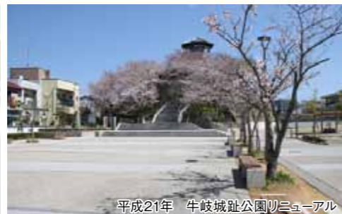
平成21年 牛岐城址公園リニューアル