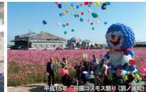
平成15年 田園コスモス祭り(羽ノ浦町)