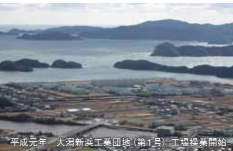
平成元年 大湯新浜工業団地(第1号)工場操業開始