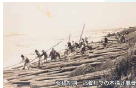
昭和初期 那賀川での木揚げ風景