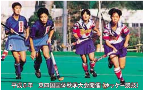
平成5年 東四国国体秋季大会開催(ホッケー競技)