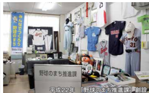
平成22年 「野球のまち推進課」創設