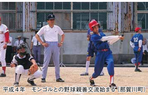
平成4年 モンゴルとの野球親善交流始まる(那賀川町)