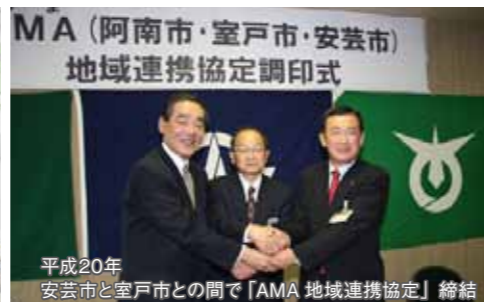
平成20年 安芸市と室戸市との間で「AMA 地域連携協定」締結