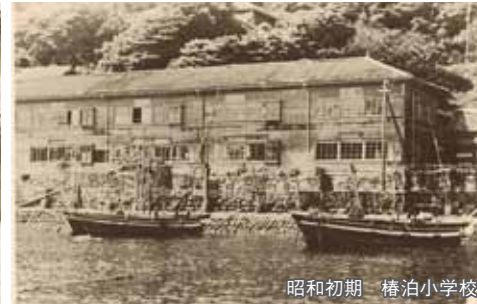
昭和初期 椿泊小学校