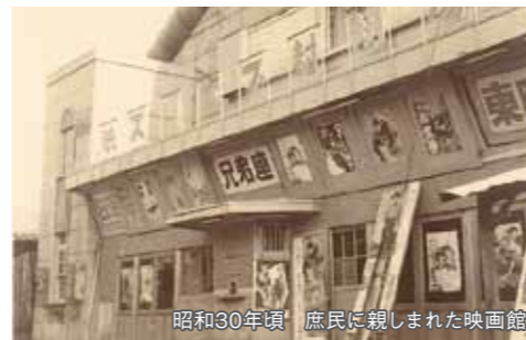
昭和30年頃 庶民に親まれた映画館