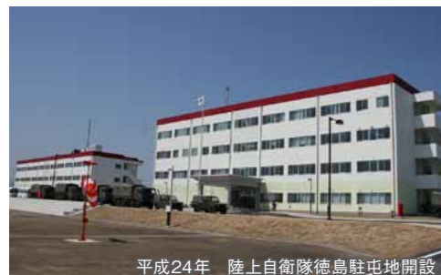
平成24年 陸上自衛隊徳島駐屯地開設