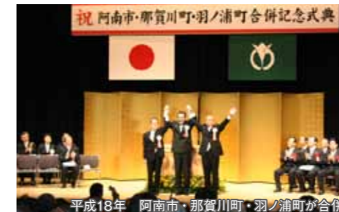
平成18年 阿南市・那賀川町・羽ノ浦町が合併