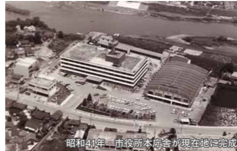
昭和41年 市役所本庁舎が現在地に完成