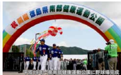
平成19年 県南部健康運動公園に野球場完成