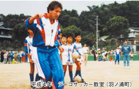
平成4年 ショコサッカー教室(羽ノ浦町)