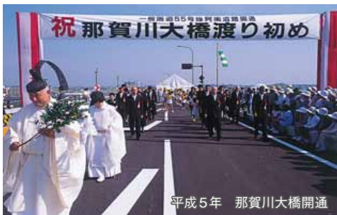
平成5年 那賀川大橋開通