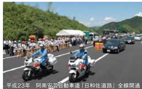
平成23年 阿南安芸自動車道「日和佐道路」全線開通