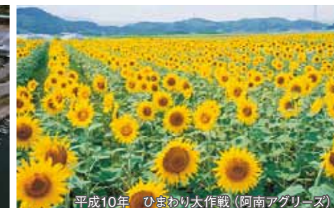
平成10年 ひまわり大作戦(阿南アグリース)