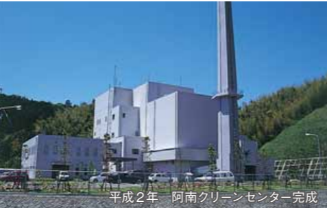
平成2年 阿南クリーンセンター完成