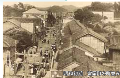
昭和初期 富岡町の町並み