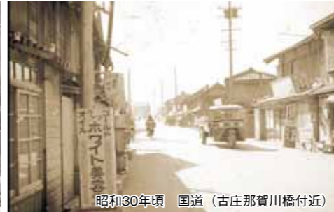
昭和30年頃 国道(古庄那賀川橋付近)