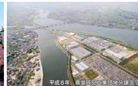
平成8年 県営辰巳工業団地分譲完了