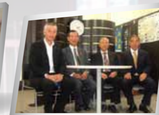
【地元からの訪問者と面会】