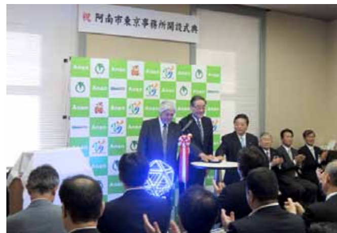
阿南光のまちづくり協議会から事務所のシンボルとして寄贈された青色LEDオブジェ「イコサ」を点灯し、開設を祝いました。

5月11日、れんが風で重厚なたたずまいの市政会館に、阿南市東京事務所開設を告げるLEDの光が燦然と灯されました。阿南市政の新たな時代の幕開けです。 地方分権の進展など地方を取り巻く時代の潮流が大きく変化するなか、地方の自立と責任を確立していくための取組が求められています。そうしたなか、私たちが掲げた目標が「風を読み、積極果敢に攻める行政」です。国の政策に関する情報収集や観光・物産のPR活動、人的交流の拠点として阿南市東京事務所は開設されました。