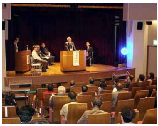
「東京・阿南ふるさと会」設立総会の様子