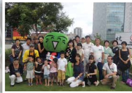
銀座白鶴ビルでのすだち収穫祭