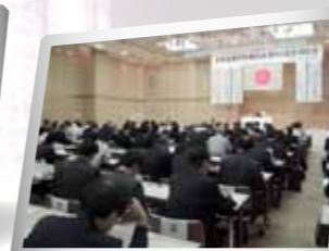
【説明会等への代理出席】