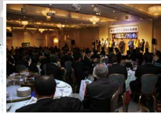
東京・阿南ふるさと光流会の様子

関東で活躍する阿南市出身者の皆さまとの交流による新たな「ふるさとネットワーク」の構築、東京と阿南のビジネスマッチングや異業種交流による企業誘致やU・J・Iターン移住交流の推進を図っています。