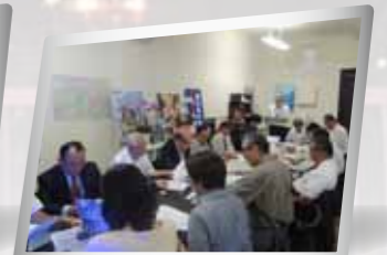
【事務所で打ち合わせ】