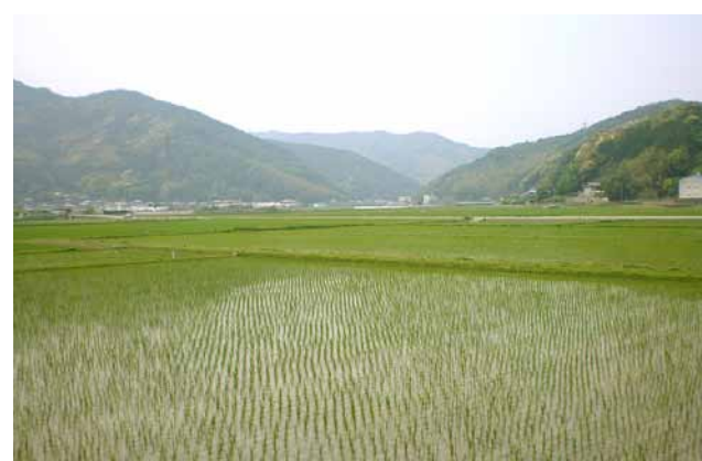
御厨と保があった桑野町。