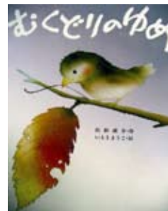
(C)浜田廣介・いもようこ・金の星社

日時 10月29日(土) 13:30開演(13:00開場) 場所 コスモホール (情報文化センター)