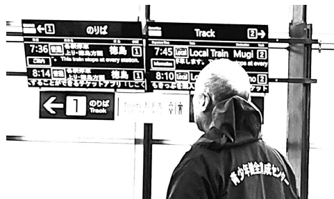
※ 1月21日 JR阿南駅にて

今回も、JR阿南駅・南小松島駅間のパトロールでしたが、真摯な態度で乗車する通学生の姿を確認することができました。また、この時期は、国家試験や大学入試などに向けて、真剣に参考書等を開く生徒が多いことにも注目しました。