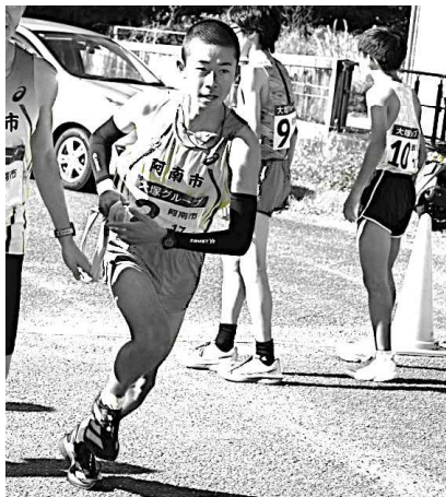
※ 1月4日 津乃峰防災公園中継所にて

さて、みなさんは、新しい学年に進級するまであと少しになりましたね。この時期は、今の学年で経験した勉強や諸活動を振り返りつつ、次の年度に向けた有意義な生活を続けてください。