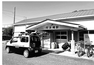
※ 1月28日 JR阿波橋駅での回収作業

本年度は、既に、2052点（1月末現在）を回収しましたが、そのなかで、DVDの回収数が、1779点（全体比86.7%）と多数を占めています。