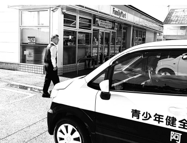
※10月23日市内のコンビニ店

また、営業日にも関わらず、この業務の実施にご協力を賜りました各店舗の店長様をはじめ関係のみなさま大変お世話になりました。今後とも、どうぞよろしくお願いいたします。