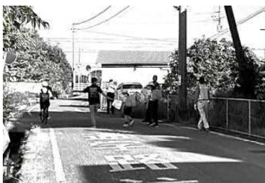
※10月1日横見小学校門前で実施

また、この日もたくさんの人たちが気持ちのいいあいさつをもらうことができました。そして、そのおかげで当センターの職員も一日中さわやかな気分で仕事ことができました。