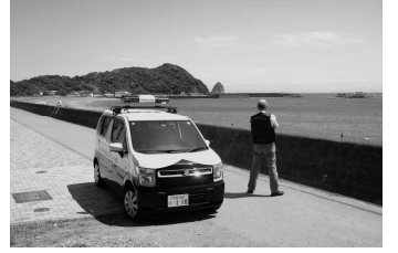
写真：北の脇海水浴場をパトロール中の当センター職員

今夏、海水浴場に出かける若者の数が増加してきました。このことを受けて、当センターでは夏季休業中及びその前後の期間、「水の事故防止」を目的としたパトロールを強化することにしました。