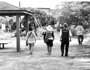
阿南警察署と合同パトロール(7月10日)