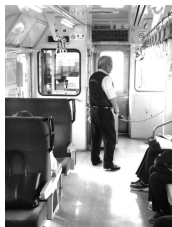
列車パトロール (7月17日)