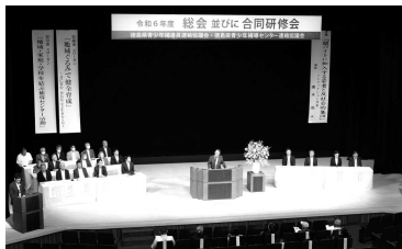
徳島県補導センター連絡協議会 総会及び合同研修会(7月6日)