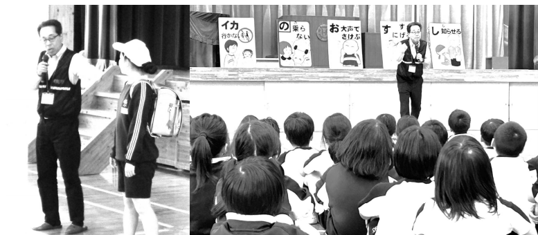
防犯教室（不審者対応訓練）於：橘小学校