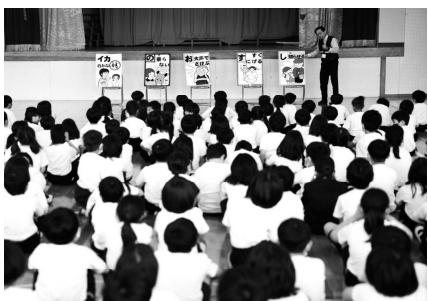
防犯教室(不審者対応訓練)(5月～10月)

昨年度、当センターが実施した同教室は、幼稚園、小学校合わせて合計13カ所を数えています。なお、開催に当たりましては、当該園長先生・校長先生を始め、関係する方々、関係諸機関等には大変お世話になりました。