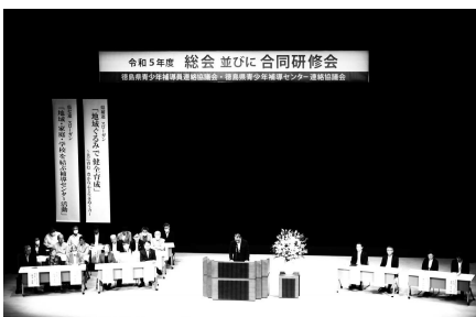
徳島県県補連総会・研修会(7月)