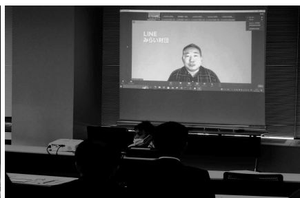
健全育成研修会(12月)