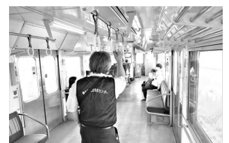
JR阿南駅～南小松島駅間の車内で

近年、乗車マナーは向上してきましたが、当センターでは今後も継続する予定にしています。