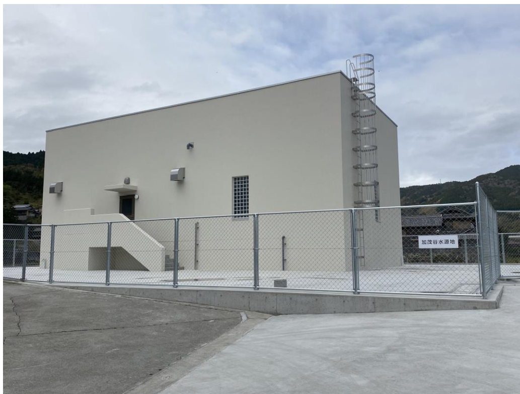
阿南市上水道加茂谷水源地