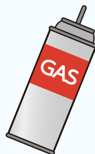
カセット式ガスボンベ

※屋内でガスを出すと、近くの火気や静電気で引火することがあります。 ※使い切れない場合や処理方法は、カセットボンベお客様センターまで お問い合わせください。☎0120-14-9996 ※引き取り回収はしておりません。