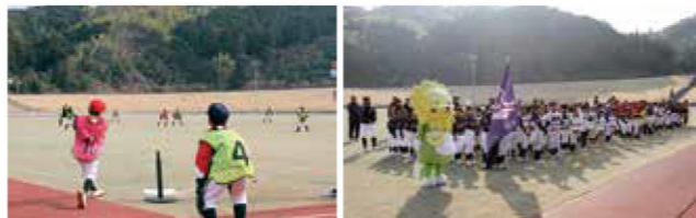
(テニール大会の様子)

【新規】キッズスポーツフェスタ開催経費 423万円 徳島出身のプロ野球選手を講師として、打つ・走る・投げるというテーマに沿ってスポーツを楽しんでもらい、スポーツ人口の増加を図ります。