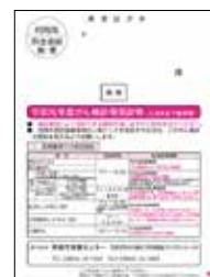
がん検診等受診券(見本)