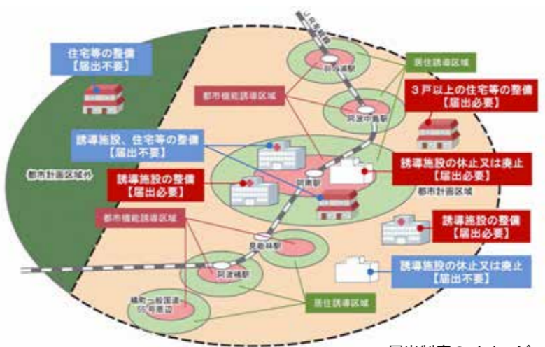
届出制度のイメージ

必要に応じて、居住誘導区域の外側に誘導施設を行う場合、一定規模以上の住宅の建築等を行う場合は、開発行為等に着手する30日前までに市長へ届け出ることが義務付けられていますので、市民の皆さんと事業者の皆さんのご理解とご協力をお願いします。